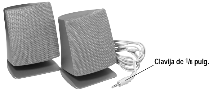
Clavija de 1/8 pulg.

Le agradecemos la compra de un sistema portátil de altavoces resistentes a salpicaduras de la marca RadioShack. El sistema de altavoces produce un sonido estereofónico superior con cualquier reproductor portátil de discos CD o radiocasetera. Estos altavoces compactos y livianos permiten disfrutar casi en cualquier parte programas de radio o música. El singular diseño a prueba de salpicaduras permite utilizar los altavoces incluso en entornos de alta humedad.